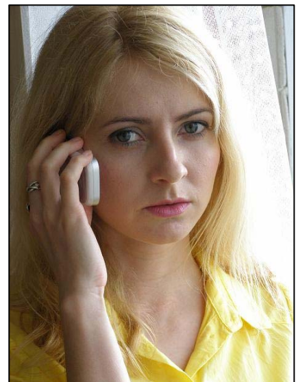
Obr. 2: Víte, co byste měli operátorovi sdělit?

Pokud zavoláte na špatné číslo, nic se neděje. Jednotlivé složky si volání předají mezi sebou. Jen budete muset třeba opakovat stejné informace, které jste již před chvílí říkali jinému operátorovi. To ale stojí drahocenný čas a záchranáři vyjedou později.